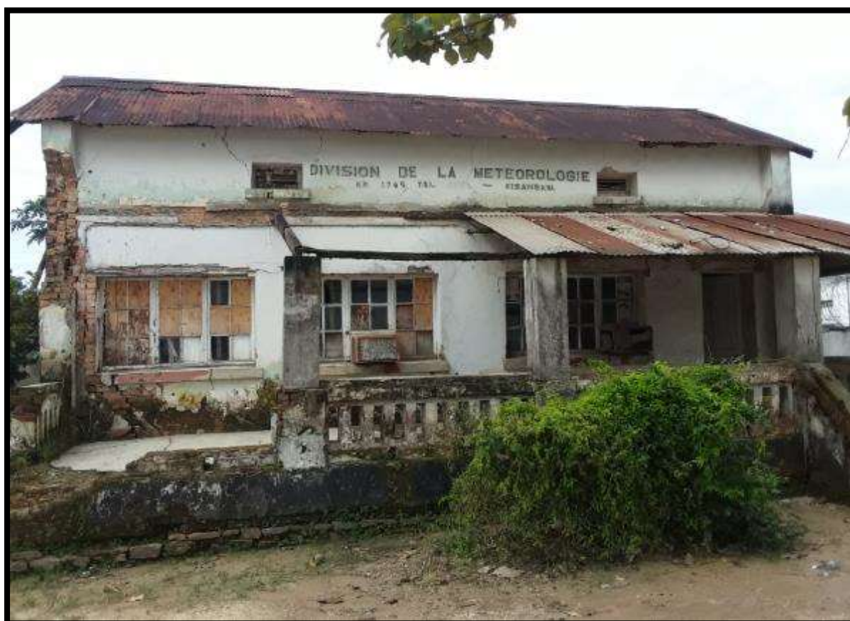
Figure 1 : Division provinciale de la METTELSAT à Kisangani

Ce faisant, une partie de ce fond est alloué à la remise à neuf du bâtiment de la division provinciale de la METTELSAT à Kisangani.