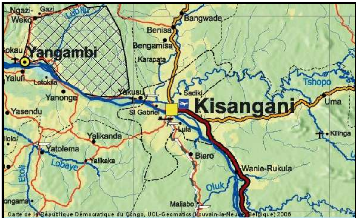
Figure 3 : Carte de localisation de la zone d'étude

Le site de la division provinciale de la METTELSAT est localisé au Nord-Est de la République Démocratique du Congo sur l'avenue MUNYORORO/R408 dans la commune MAKISO, ville de Kisangani, chef-lieu de la province de la TSHOPO.